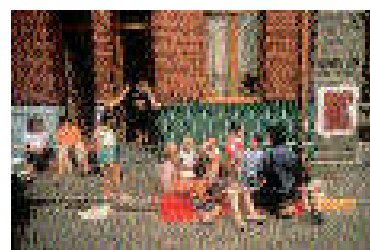
A la rencontre des enfants

- Les particuliers et les acteurs économiques peuvent soutenir financièrement la campagne « Refuser la misère, un chemin vers la paix », afin de couvrir les frais que celle-ci occasionne, notamment pour la collecte des signatures de la Déclaration de solidarité et l'organisation des rassemblements de la Journée Mondiale du Refus de la Misère.