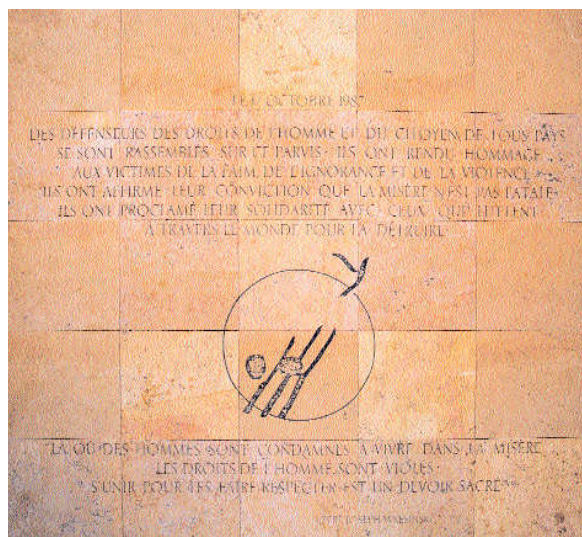
Dalle à l'honneur des victimes de la faim, de l'ignorance et de la violence lors du rassemblement des défenseurs des Droits de l'Homme le 17 octobre 1987.

- Interpeller les pouvoirs publics à tous les niveaux : locaux, nationaux et internationaux, pour leur demander de prendre en compte la vitalité de ce courant et d'y contribuer. Pour cela ils peuvent s'informer et tenir compte dans leurs décisions politiques et administratives des résultats positifs obtenus par les acteurs de ce courant et soutenir financièrement ces initiatives pour qu'elles se développent plus largement.