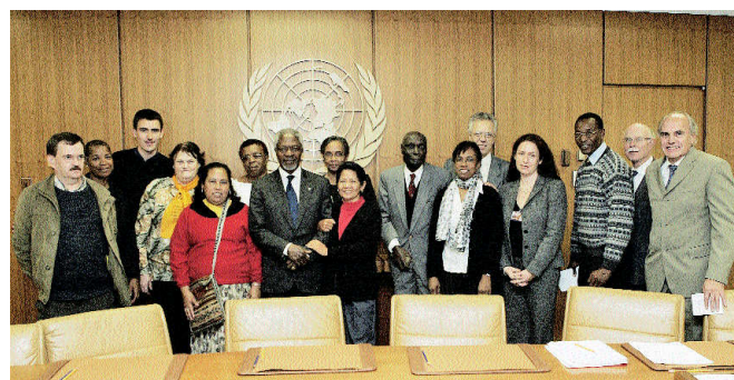
Rencontre à l'O.N.U. avec M Kofi Annan - 2005