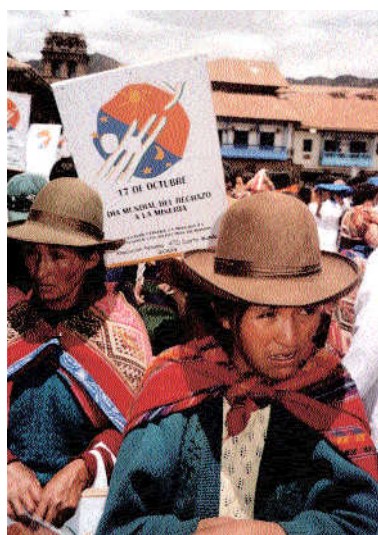
Le 17 octobre à Cusco Pérou

Ils rendront public les actions menées par ce courant, pour sensibiliser l'opinion publique et offrir à un maximum de personnes l'opportunité de découvrir comment elles aussi peuvent s'impliquer.