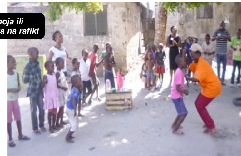
Maktaba Maalum ya mMtaa Tandale. Watu kutoka Kongo, Kenya walikutana na walikuwa na wakati wa urafiki kabla ya kuanza semina.